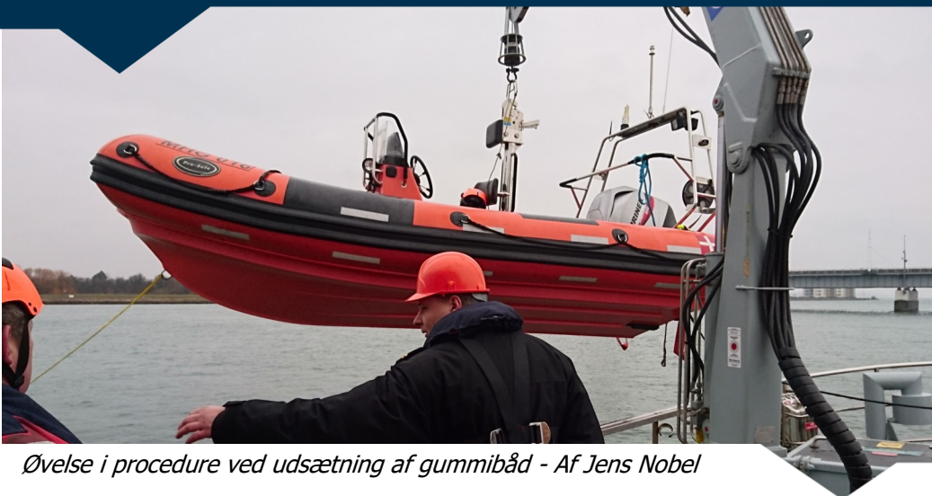
Øvelse i procedure ved udsætning af gummibåd - Af Jens Nobel