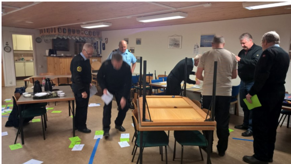
Der øves farvandsafmærkninger i teorilokalet.

Besætningen blev til ud fra et ønske fra staben om, at oprette et fast sted i flotillen til uddannelsesgaster. Staben ønskede at sikre, at nye gaster fik den nødvendige erfaring og blev forberedt mest muligt til de lovpligtige uddannelser således at gennemførelse af lovpligtig uddannelse sikres for hvert enkelt medlem.